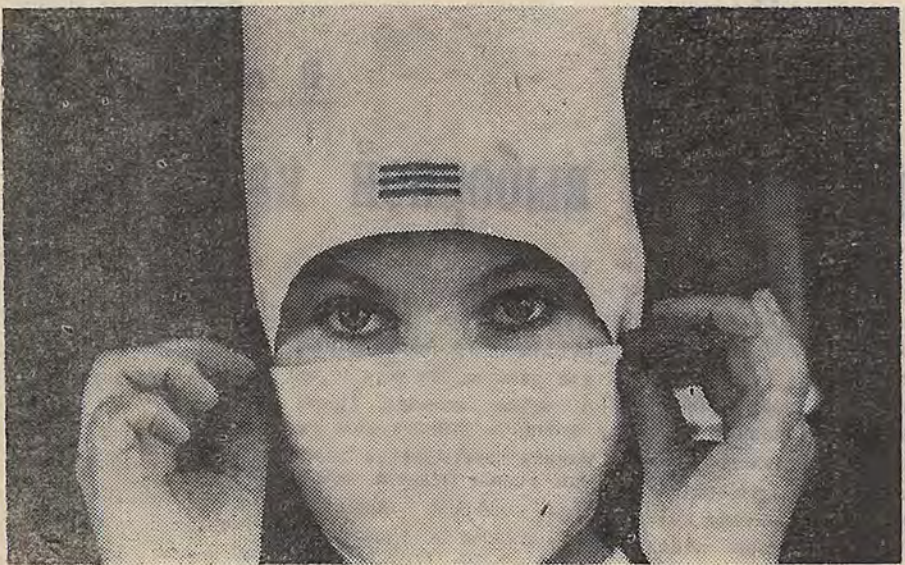
К 70-летию Великого Октября