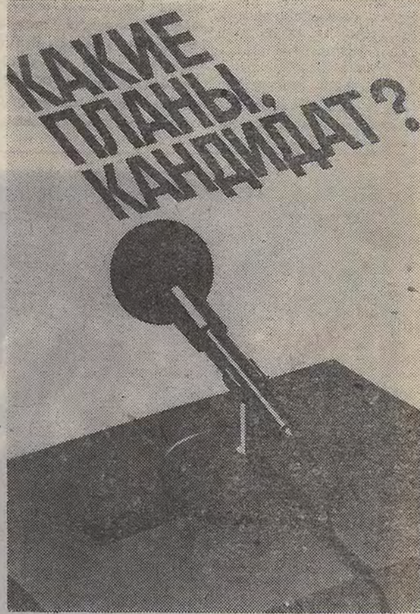
Плакат художника Н. Усова. Издательство «Плакат».

До выборов в местные Советы народных депутатов и народных судей районных (городских) народных судов осталось 10 дней