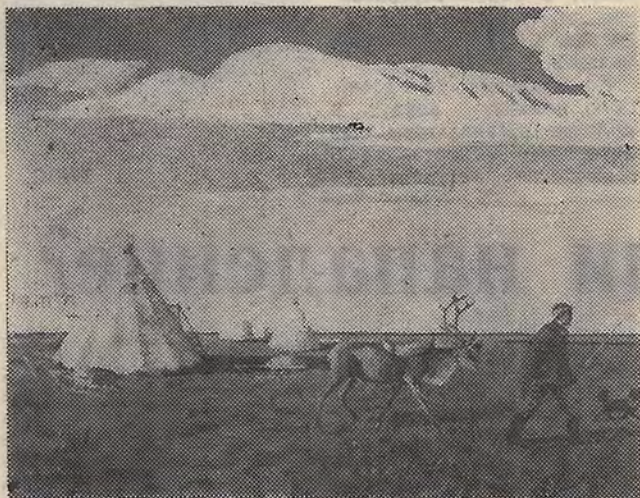
В СТУДЕНЧЕСКОЙ картинной галерее завершается выставка работ живописца Юрия СПИРИДОНОВА.